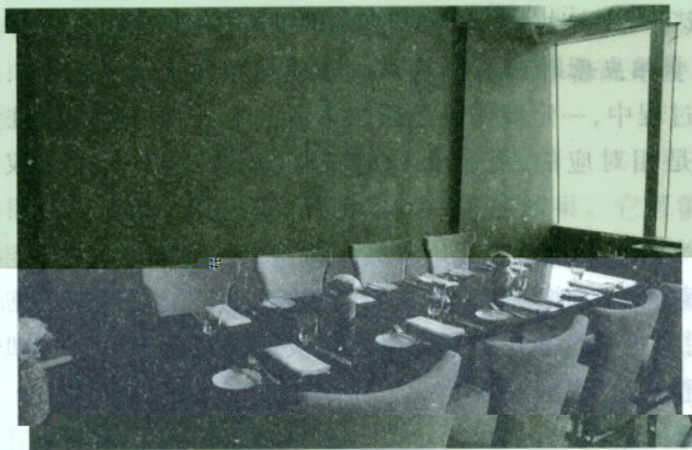
图 4-1 餐厅环境

混合性决策是指决策的作出既含有定性决策的成分,又要采用定量决策的方法。在饭店经营过程中,绝大多数的决策都属于这种混合性决策。